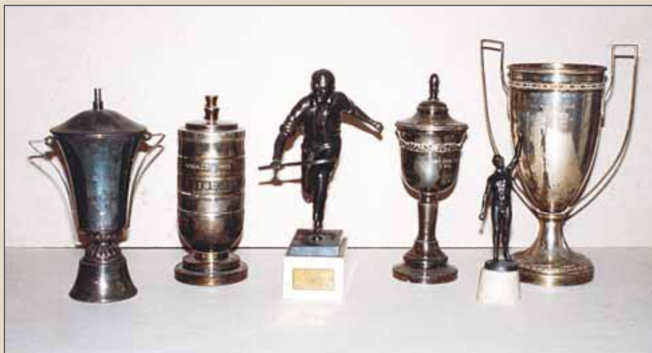
Trofejni predmeti iz zbirke Dragutina Friedricha

Ostavština Dragutina Friedricha pravi je biser u fundusu Hrvatskog športskog muzeja. Predmeti su proizvedeni u razdoblju kada im se u društvu pridavalo iznimno značenje. Dio predmeta stranog je porijekla, pa ih možemo uspoređivati s onima proizvedenim u nas. Medalje, pehari, plakete, značke i trofejni predmeti upornog značenja odišu neobičnom ljepotom i muzejski su predmeti nulte kategorije. Brojne fotografije precizno su opisane, a sačuvani